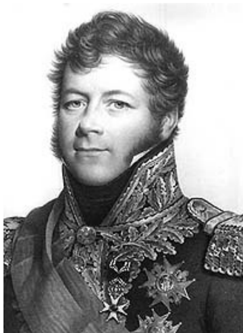
Посол Франции маркиз де Мезон