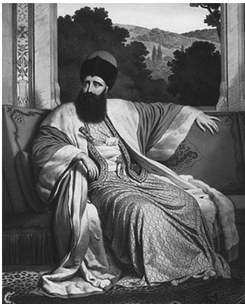
Молдавский господарь Михай Суццо, впоследствии — посланник Греции в С.-Петербурге