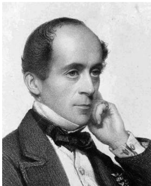
Атташе британского посольства виконт Челси