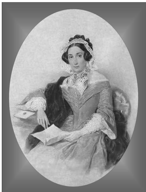
Графиня Д.Ф. Фикельмон