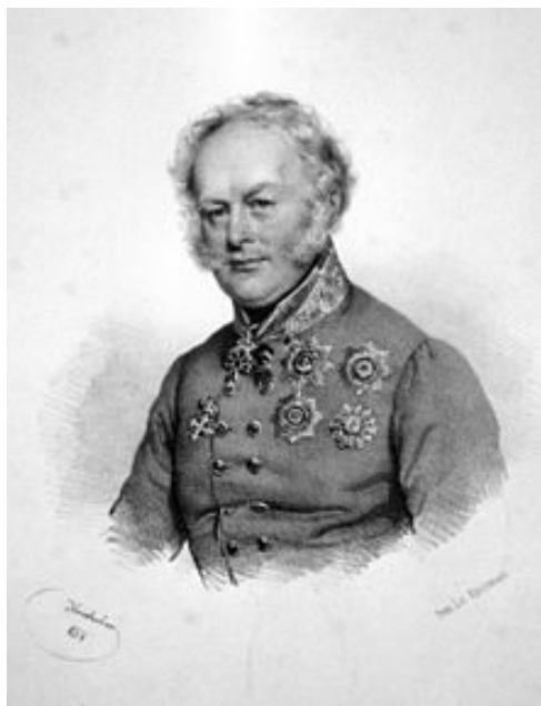
Посол Австрии граф де Фикельмон