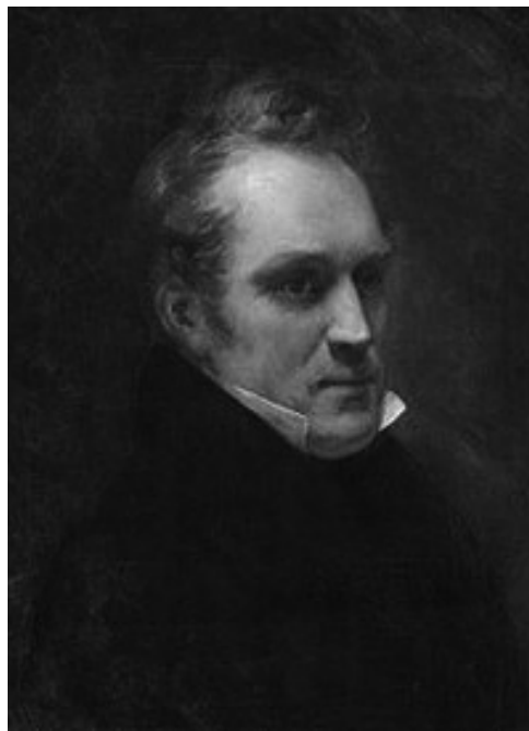
Посол Франции барон де Барант