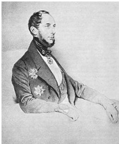
Посланник Нидерландов барон Геккери