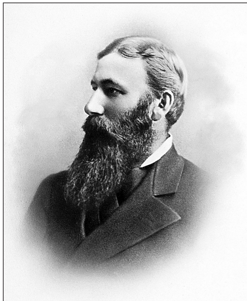
Вице-консул Густав Фердинанд Ньюбаум

Весной 1880 г. первый секретарь российского консульства в Иокогаме, барон Роман Романович фон Розен, который родился 12 февраля 1847 г. в Ревеле (ныне Таллинн), получил временное назначение в США на пост генерального консула в Сан-Франциско, где пробыл до декабря, когда отправился обратно в Японию 38 . В дальнейшем он был генеральным консулом в Нью-Йорке (1884–1886), временным поверенным в делах в Вашингтоне (1886–1889),