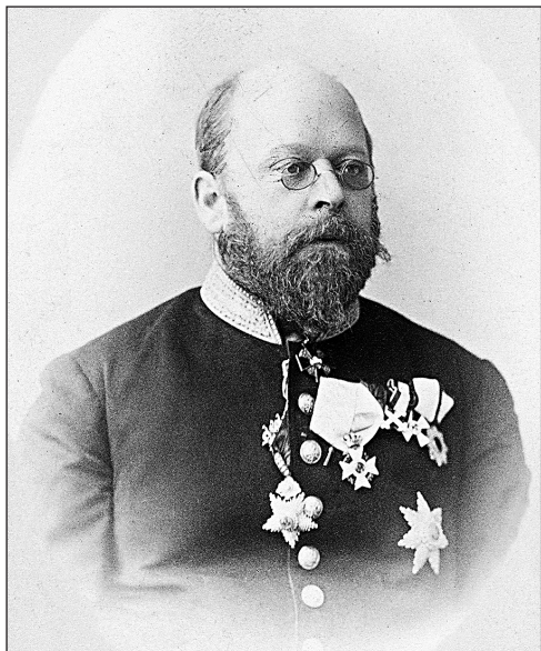
Генеральный консул Александр Эпиктетович Оларовский

В Сан-Франциско барон Розен проживал в известной гостинице «Palace Hotel» и, как он позднее вспоминал, дышал бодрящим и оживляющим тихоокеанским воздухом, посещал местные достопримечательности и ожидал дальнейших указаний МИДа 39 .